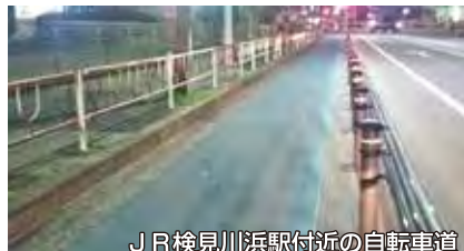
JR検見川浜駅付近の自転車道