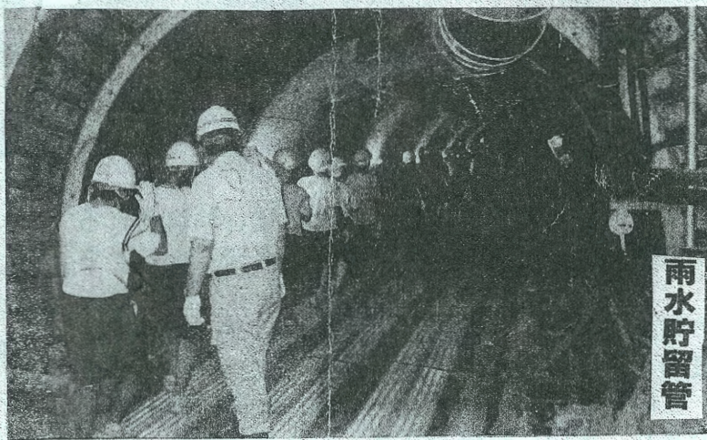
直径3.25m×長さ964mの雨水貯留管

3.さんぺい質問 道路雨水浸透樹が設置されている場所について色々伺っている。浸透樹を設置して効果のある所は、他にも多くある。もっと増やすべき、今後の予定を伺う。 答弁 浸水被害軽減のために現地調査をし、道路浸透樹の設置の検討をする。