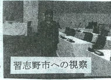
習志野市への視察