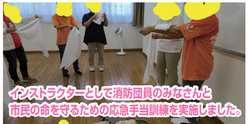
インストラクターとして消防団員のみなさんと市民の命を守るための応急手当訓練を実施しました。