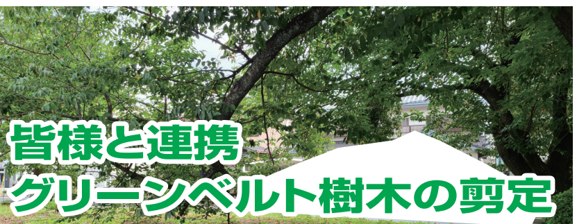
皆様と連携 グリーンベルト樹木の剪定